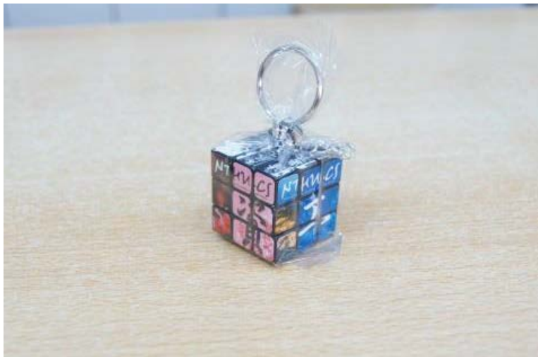
[圖片參考：(由上至下)2012 清華資工魔方鑰匙圈平面示意圖、2011 清華資工魔方鑰匙圈實品及包裝]